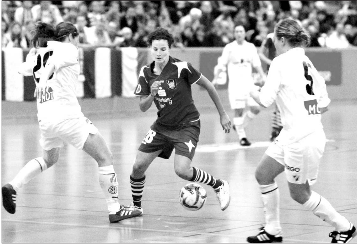
Frauenfußball der Extraklasse ist am Wochenende in Jöllenbeck wieder garantiert.

Die Teilnahme an der Talentsichtung ist kostenlos. Mitzubringen sind Hallenschuhe, Sportbekleidung und ein Getränk. Es wird um eine Voranmeldung bei Klaus Vogt (0521/950682) oder per E-Mail unter fa.klausvogt@t-online.de gebeten. Die Sichtung findet morgen von 16 bis 18 Uhr in der Turnhalle Bahnhofsstraße, Buschkampstraße 134, in Bielefeld-Senne statt.