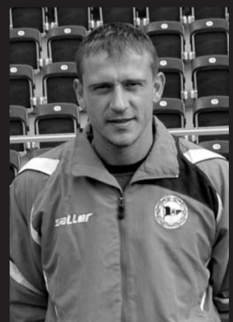
Jörg Böhme will dazu beitragen, dass der sofortige Wiederaufstieg gelingt.

minia-Trikot. Seine weiteren Stationen als Profi waren FC Carl Zeiss Jena, 1. FC Nürnberg, Eintracht Frankfurt, 1860 München, Schalke 04 und Borussia Mönchengladbach. Insgesamt absolvierte Böhme 233 Bundesliga- sowie 43 Zweitligaspiele. Dabei erzielte er 31 bzw. 3 Tore. Zudem gehörte der 10-malige Nationalspieler zum Vize-Weltmeisterteam 2002.